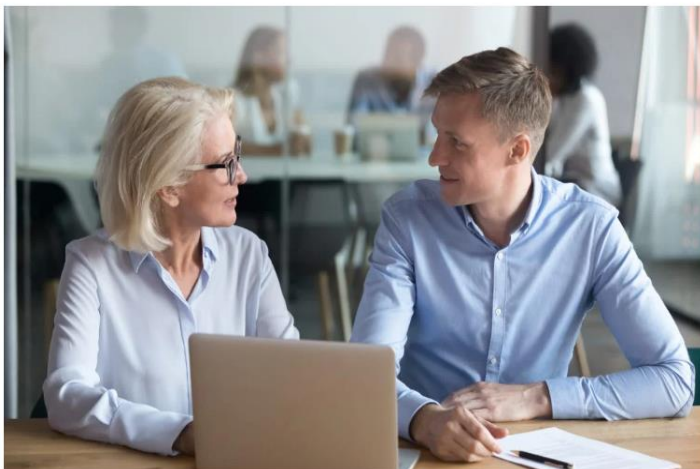
Malen og appen ble lansert 3. juni på et webinar.

3. juni lanserte KS en mal for utviklingssamtalen mellom folkevalgt og kommunedirektør, samt en app for utvikling av godt samspill mellom ordfører og kommunedirektør. Se opptak av webinarer her.