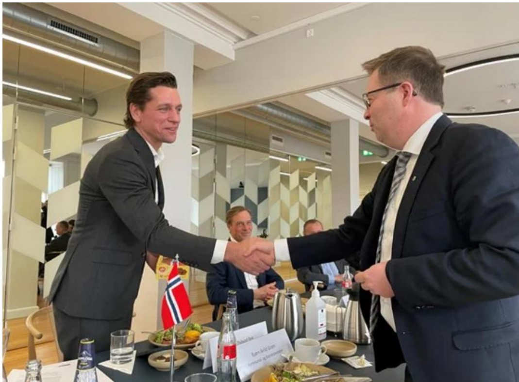
STATSRÅDSMØTE: Kommunal- og distriktsminister Bjørn Arild Gram med sin danske kollega, innenriksminister Kaare Dybvad Bek.