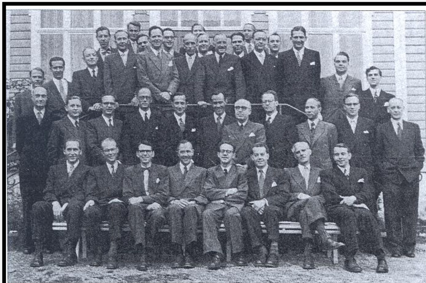
Det første «Solstrandkull» (1953)